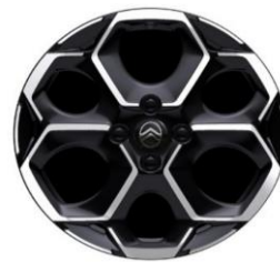
17 Zoll Leichtmetallfelgen ATACAMITE (MAX)