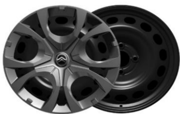
16 Zoll Stahlfelgen PYRITE (YOU)