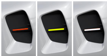
ANDRE ROT NEON GELB BANQUISE