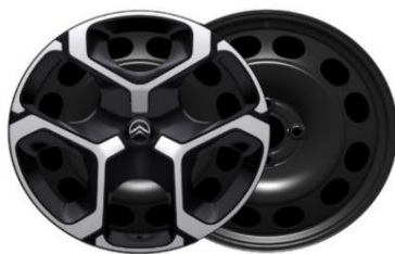
17 Zoll Stahlfelgen AZURITE (YOU Pack PLUS)