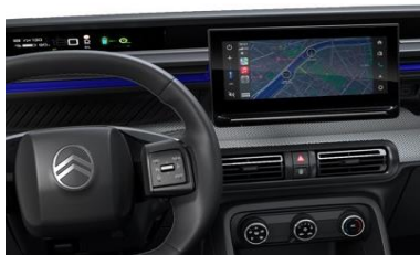
MY CITROËN PLAY (YOU Pack PLUS)